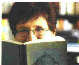
di Nicoletta Sipos