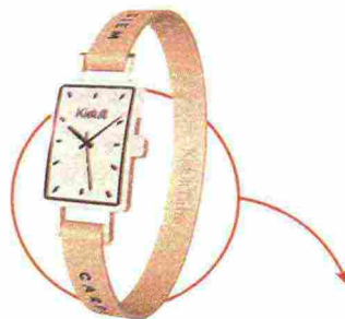
L'OROLOGIO DI KIDULT COMPLETA QUESTO LOOK