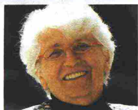
di Nicoletta Sipos