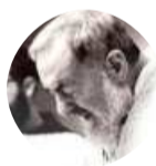
Padre Pio raccontato attraverso 77 testimonianze di modenesi che sostengono di essere stati miracolati

3 anni ha sofferto di una grave malattia che secondo i medici l'avrebbe portata a morte certa. A 7 anni, ormai gravissima, dopo un incontro con Padre Pio, grazie alla sua intercessione, guarisce inspiegabilmente. Come segno di gratitudine decide di scrivere questo libro che riporta quasi altre ottanta storie di modenesi che sostengono di essere guariti nello stesso modo. Un rendez-vous, una carezza, la guarigione: «la cosa più bella che l'incontro con Padre Pio mi ha dato – scrive l'autrice – oltre la sa-