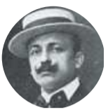
Filippo Tommaso Marinetti a fianco l'immagine scelta per la copertina

Ripubblicato il testo Filippo Tommaso Marinetti fondatore del futurismo