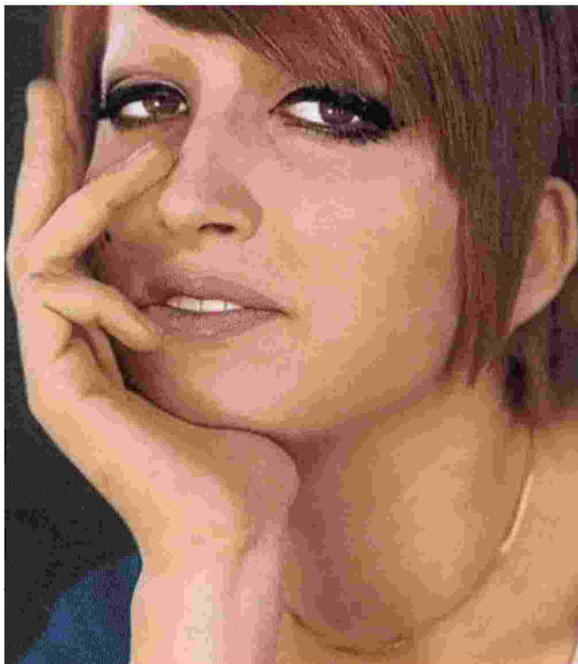
Un primo piano in gioventù di Mina Anna Maria Mazzini, in arte Mina: oltre sessant'anni di carriera