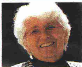
di Nicoletta Sipos